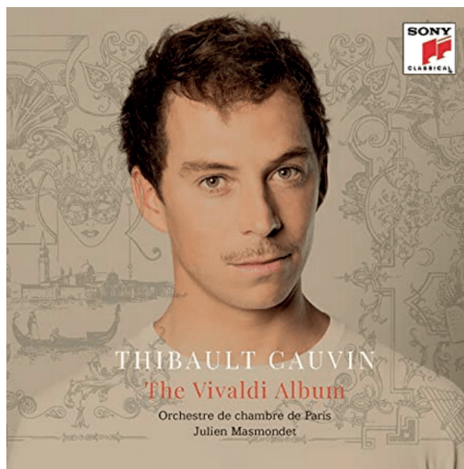
The Vivaldi Album

Klingt der Explorer also perfekt? Nein, das tut er nicht! Er übertreibt es im Bass sogar etwas, und seine Mitten tönen leicht zurückgenommen. Dennoch ließ er mich in die Seele einer Aufnahme tief hinein hören, und wenn sich ein Musikstück als akustisch unvoreteilhaft erweist, dann war das erfreulicherweise überhaupt kein Problem: Der Lautsänger ist nämlich das genaue Gegenteil einer High-End-Klangmimose, die nur dann zu großer musikalischer Form aufläuft, wenn die gesamte Signalkette ultrahochwertig und ultrateuer ist.