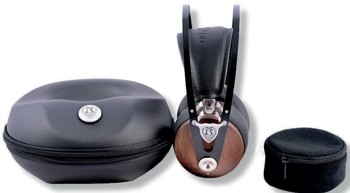
Explorer mit Aufbewahrungsbox und Kabel-/Adaptertasche

Aber verlassen wir Bayreuth gleich wieder und reisen stattdessen nach Hirschhorn am Neckar, wo die noch junge Manufaktur Lautsänger sitzt. Das Team, das dort seit rund anderthalb Jahren zusammenarbeitet, besteht aus Wissenschaftlern, Künstlern und Handwerksmeistern, die sich alle der Kymatik verschrieben haben. Der Standort im Odenwald liegt ideal, denn in der Nähe befindet sich nicht nur die Universitätsstadt Heidelberg, sondern auch das ehemalige Zentrum der deutschen Elfenbeinschnitzer-Kunst: Erbach.